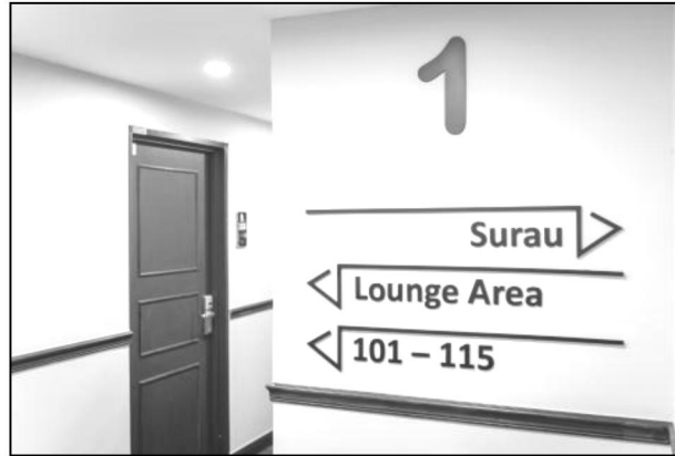
Figure 2/ Rajah 2