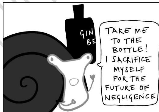
Figure 1/ Rajah 1

(b) Based on Figure 1, analyze the case of Donoghue v. Stevenson (1932)